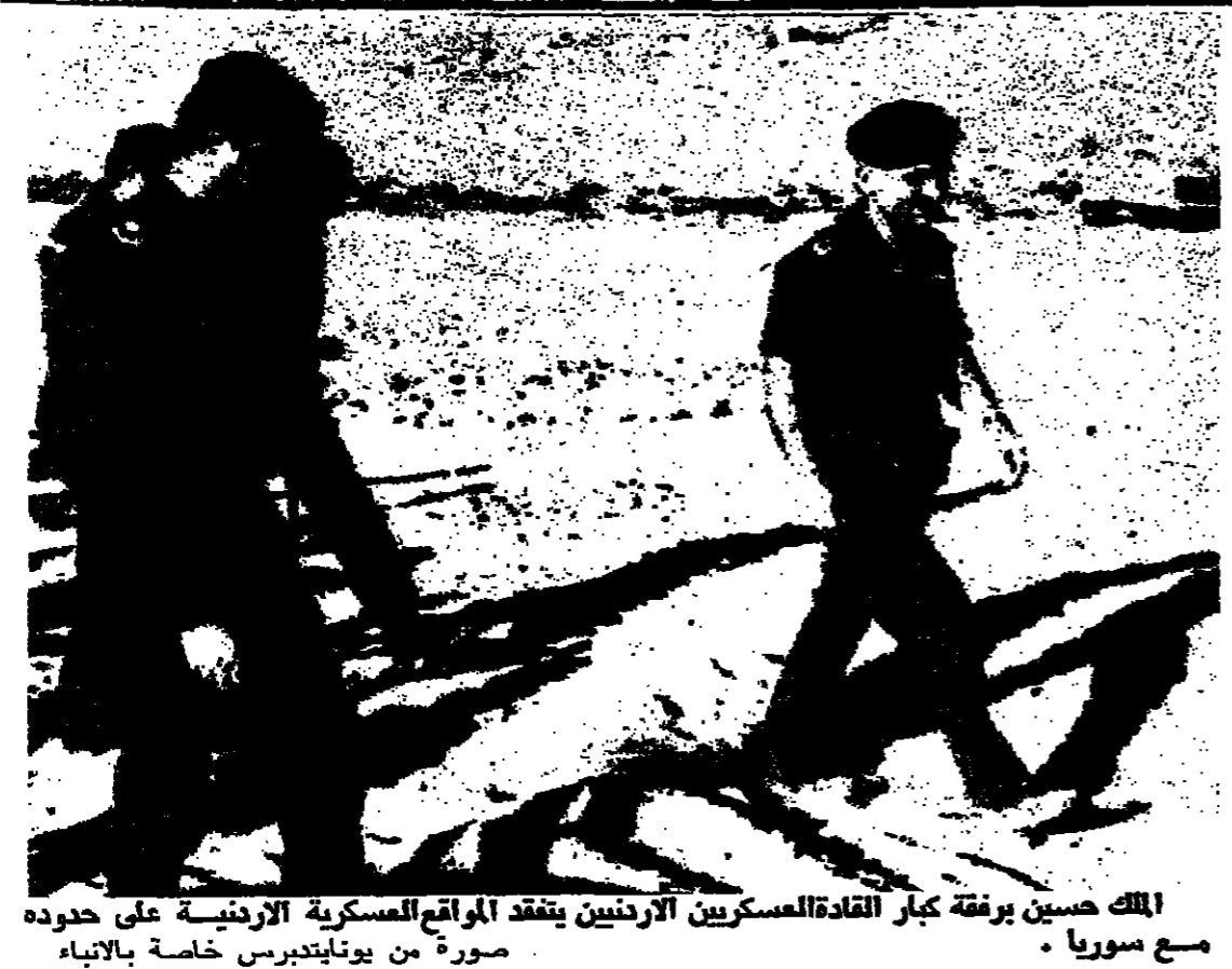
الملك حسين يرفقه كبار القادة العسكريين الأردنيين يتفقد المواقع العسكرية الأردنية على حدود مع سوريا.

أميركا تقترح تشكيل لجنة دولية لبحث المطالب الإيرانية حول ممتلكات الشاه الجزائر - اجتمع هنا أمس نائب وزير الخارجية الأميركية السيد دون كريستوفر مع وزير الخارجية الجزائري السيد محمد بن يحيى حيث سلمه الإيضاحات الأميركية التي طلبتها الحكومة الإيرانية بالنسبة لعدد الأميركيين على الشروط الإيرانية للإعراج عن الوثائق الأميركية المحتجزين في طهران. وذكر أن التوضيحات الأميركية الجديدة قد تتغير عندما يتولى الرئيس الأميركي الجديد رونالد ريغان مهام منصبه في الـ ٢٠ من شهر كانون الثاني المقبل. وعلم أن الولايات المتحدة اقترحت في ردها تشكيل لجنة دولية للبحث في مطالب الشركات الأميركية ضد إيران والشروط الإيرانية بإعادة ممتلكات الشاه الراحل.